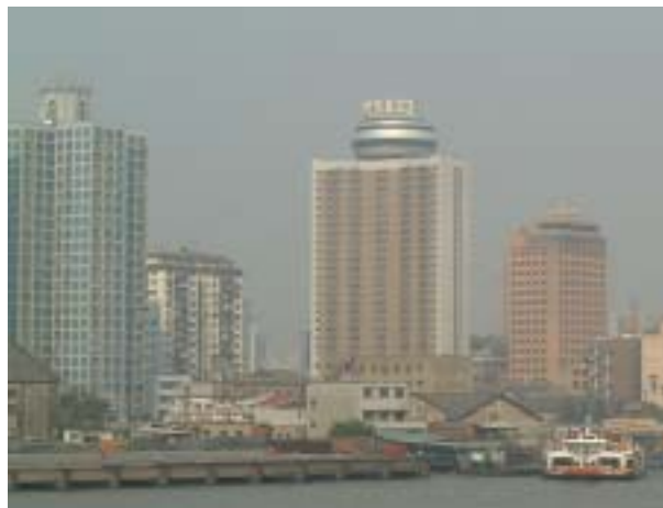
Ocean hotel och DongHong hotel ligger i samma byggnad, den runda blutten längst upp är den snurrande restaurangen.