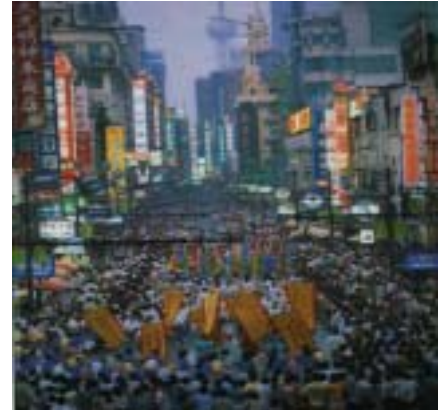
Fullt med folk på Nanjing Lu, den stora shoppinggatan i Shanghai.