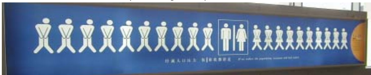
Skylt på Beijings flygplats. "If we reduce the population, everyone will feel relief".

8:50 Landar om 20 min. Small step for man, giant step for Fredrik!