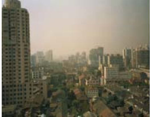
Smogig vy från hotellrummet.

Smoggen ligger tät över Shanghai, och det känns i ögonen, halsen och nasan. Mina vita handdukar är numera gråskåda. Nu förstår jag varför alla kineser harklar sig ljudligt och skickar ut stora snorlommor där de sitter och där de står.... Även här på internetcaféer och i restauranger om så krävs.