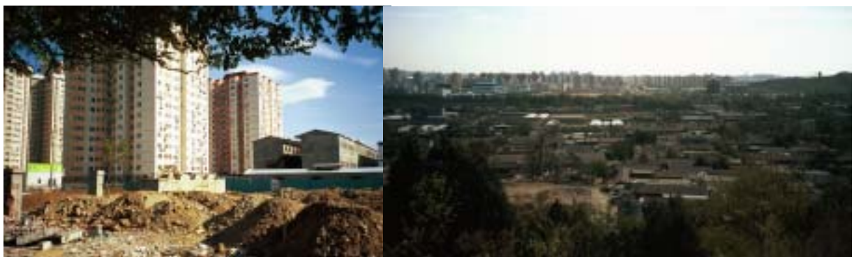
En skog av höghus och till höger kan man se lite av kåkstaden ovanifrån.

Igar var det annu en dag alena och jag undrade vad gora? Jag reste med min nyfunna van tunnelbanan till den vastliga andstationen for att se var de riktiga kineserna bor. Det var fullt med hoghus och jag gick och gick. Harute tittade folk pa mig, det ar nog inte sa vanligt med utlanningar har. Plotsligt fick jag syn pa bergen och jag visste vad jag skulle gora av dagen.... Jag skulle vandra i de kinesiska bergen. Jag gick och gick genom en skog av hoghus. Nar hoghusen tog slut kom jag till ett industriomrade