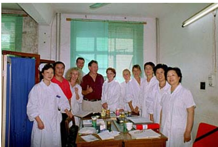
Min grupp i mottagningsrummet på Seamen's hospital.

Vi hade en lång lunch. Två timmar, vilka användes till att äta och sova middag. Doktorerna sov på britsarna. Själva slumrade jag ofta till på kanten av en vacker damm utanför sjukhuset. Fantastiskt skönt och välbehövligt.