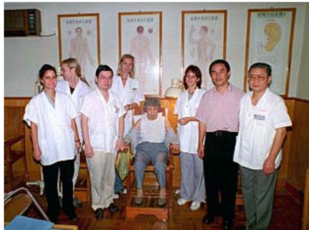
En annan grupp på Xiangshan.