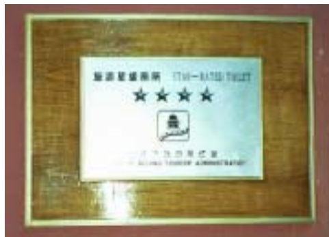
Fyrstjärnig toalett vid Ming-gravarna. Det var inga hål i backen. ALLT var automatiskt.

Vid Minggravarna gick vi över vägen för att gå in på en Sharonodling där vi pallade ett par. Kul. Har aldrig pallat Sharon förut.