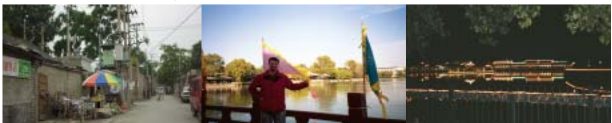
HuTongs och QianHai. Mörkret han falla innan vi druckit ur.